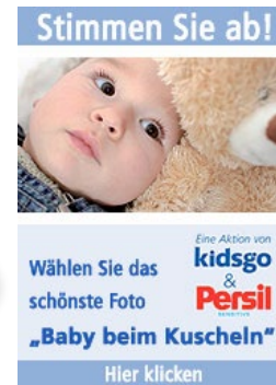
3 Stopper im Magazin, Gesamtauflage ein Quartal rd. 255.000 Exemplare und gebrandete Navibanner auf kidsgo.de, 100.000 Add Impressions