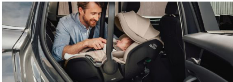
BABY-SAFE-PRO von Britax Römer: i-Size-zertifiziert, mit Ergo-Recline-Funktion.

Bei Britax Römer zeigt sich, worauf es ankommt: höchste Sicherheitsstandards nach UN ECE R129 (i-Size), durchdachte Ergonomie und Merkmale, die auch im Alltag und auf Reisen einfach funktionieren.