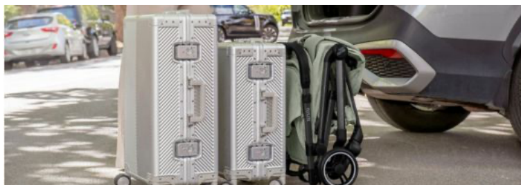
FLYLITE von Britax Römer: IATA-konform, einhändig faltbar.

Ein guter Reisebuggy entscheidet, ob das Reisen entspannt beginnt oder schon am Flughafen im Stress endet. Worauf du beim Kauf oder bei einer Empfehlung achten solltest: