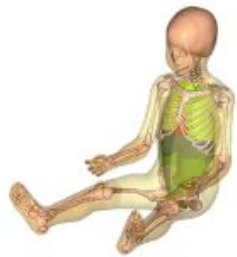
Human Body Model