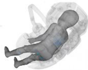
Visualisierung der Druckverteilung in einer Babyschale

Bilder: Entwicklung von Kindersitzen, Römer Britax