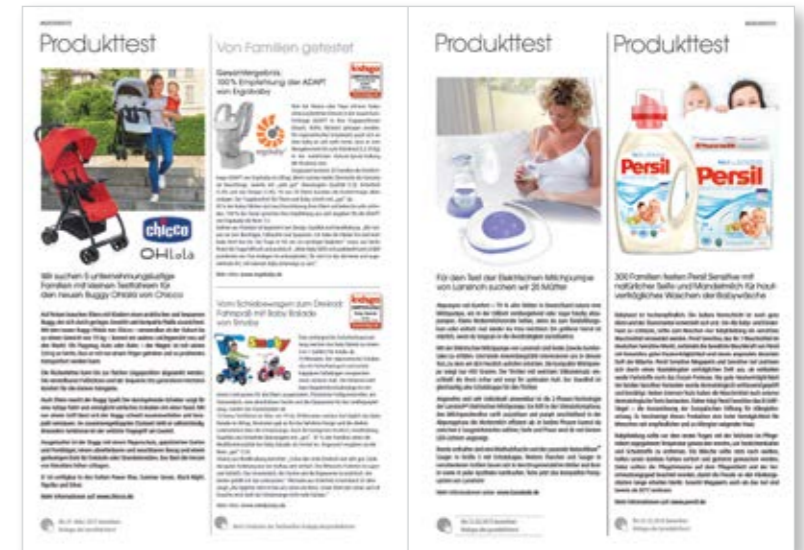
Präsentation im Print – Gestaltung kann variieren

Wir übernehmen für Sie das komplette Handling und begleiten Sie durch den gesamten Test – mit Ablaufplan, Versand der Testprodukte, Timing und Koordination.