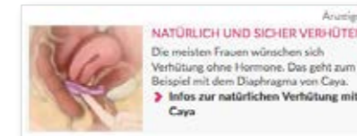
Teaser auf der Übersichtsseite

100.000 AI's / Jahr Microsite-Einrichtung: einmalig 500 € Laufzeit: mind. 12 Monate Preis: 1.490 € / Jahr