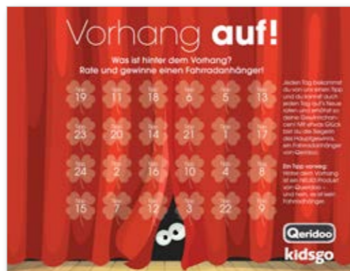
Entwurf – Gestaltung nach Absprache

zzgl. der von Ihnen zur Verfügung gestellten und verschickten Gewinne