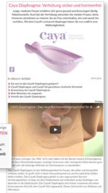
Microsite mit Artikel und Videointegration