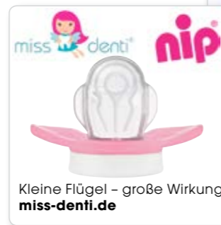
Kleine Flügel – große Wirkung miss-denti.de

Laufzeit: 3 Monate Print und Social Media Preis: 490 € je Quartal